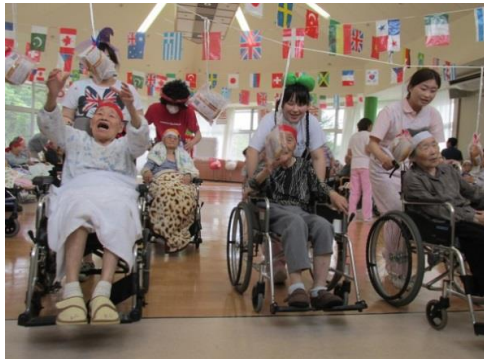
パン食い競争で楽しむ利用者様達

今年は、赤白引き分けで終わりましたが、皆様に楽しんで頂けたようであり、心地よい汗を流すことができました。