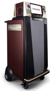
生活総合機能改善機器 FREE DAM

今年度よりデイサービスに新しくカラオケの機器が加わりました。ただのカラオケだけではなく、全身の体操プログラムやお口や頭の体操、頭の体操そのほかに、クイズや懐かしの映像などを鑑賞できるなど、多彩な機能がふんだんに盛り込まれています。利用者様も積極的に参加され、楽しく行っております。