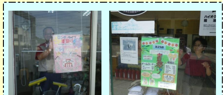
夏祭りの手作りポスターを地域の各店舗に貼って頂きました。御協力頂きありがとうございました。