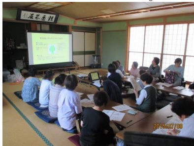
地域で行われた認知症 サポーター養成講座の様子

平成27年10月4日(日) 第2回徘徊模擬訓練 を行います。 ご参加よろしく お願いします