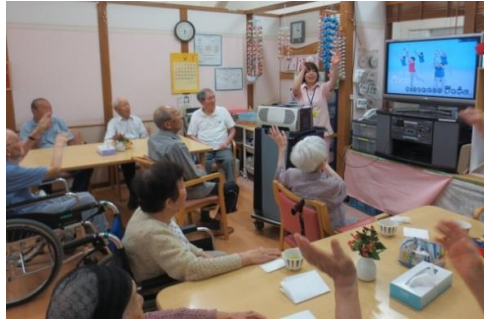
FREE DAMの機器を利用して 体操をしている利用者様

興味のある方は、デイサービスに見学にお越しください。職員一同皆様のお越しを心からお待ちしております。宜しくお願い致します。