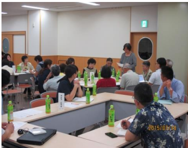
徘徊模擬訓練 打ち合わせの様子