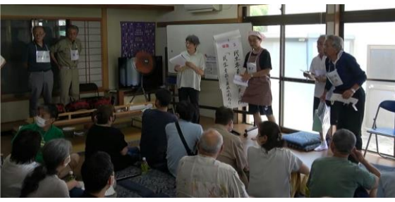
第10回 松川地域認知症SOSネットワーク模擬訓練