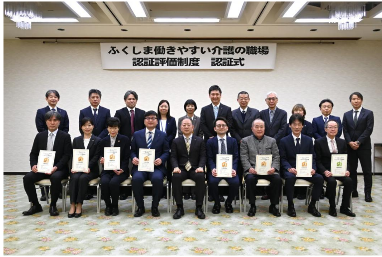
令和7年度認証式 2026/2/13 杉妻会館

このたび、社会福祉法人ライフ・タイム・福島は、福島県が実施する「ふくしま働きやすい介護の職場認証評価制度」において、ハイレベル認証を取得し、令和八年二月十三日に開催された認証式に出席いたしました。 本評価は、働きやすい環境整備、介護人材の参入・定着を促進するための人材育成等の取り組みを評価されたものです。関係する多くの方々に感謝申し上げます。 今後も、職員一人ひとりがやりがいを持って働ける環境を整え、ともに、より質の高いサービスの提供に努め、地域福祉の向上に貢献してまいります。